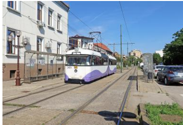
De tramkosten worden in elk geval vergoed. Nu nog een huis...

woonruimte is er nog niet. Wel zijn ze, door Manna, in beeld gekomen bij de gemeente. Daardoor kwam er wel hulp voor de tramkosten. De kinderen moeten met de tram naar school.